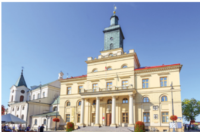
▲ Nowy klasycystyczny budynek ratusza w Lublinie