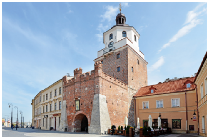
▲ Brama Krakowska

Tereny Lublina niewątpliwie były zasiedlane w dawnych wiekach. Dane archeologiczne są jednak szczątkowe. Osadnictwo na terenie prawobrzeżnego Lublina (na osiedlu Piaski) sięga neolitu. Na Kalinowszczyźnie zostały znalezione artefakty kultury łużyckiej. Okres wpływów rzymskich i wczesnego średniowiecza dokumentują pojedyncze, luźne znaleziska. Datowane na IX w. arabskie dirhamy potwierdzają istnienie prowadzącego przez teren Lublina