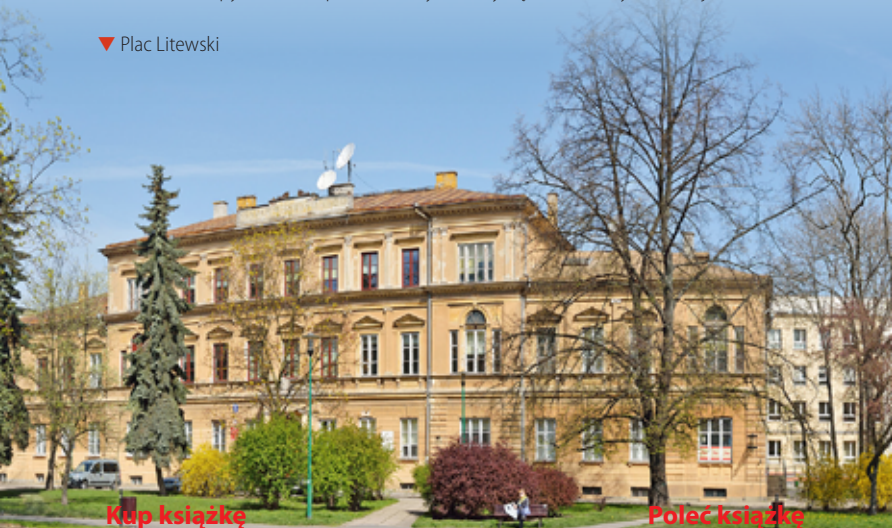
▼ Plac Litewski

w latach 1809–1903 do fasady dobudowano nad dzwonnica renesansową attykę, a nad kruchtą szczyt, ozdobiony polichromią autorstwa W. Barwickiego, z przedstawieniem patronów zakonu oraz Matką Bożą Szkaplerzną. W 1905 r. przeprowadzono kolejny remont: odnowiono wnętrza, ołtarze, zamurowano wejścia do krypt. Po I wojnie światowej karmelici odzyskali część pomieszczeń, zaś reszta była do dyspozycji wojska. Mieściły się tu warsztaty kołodziejskie, kuźnia,